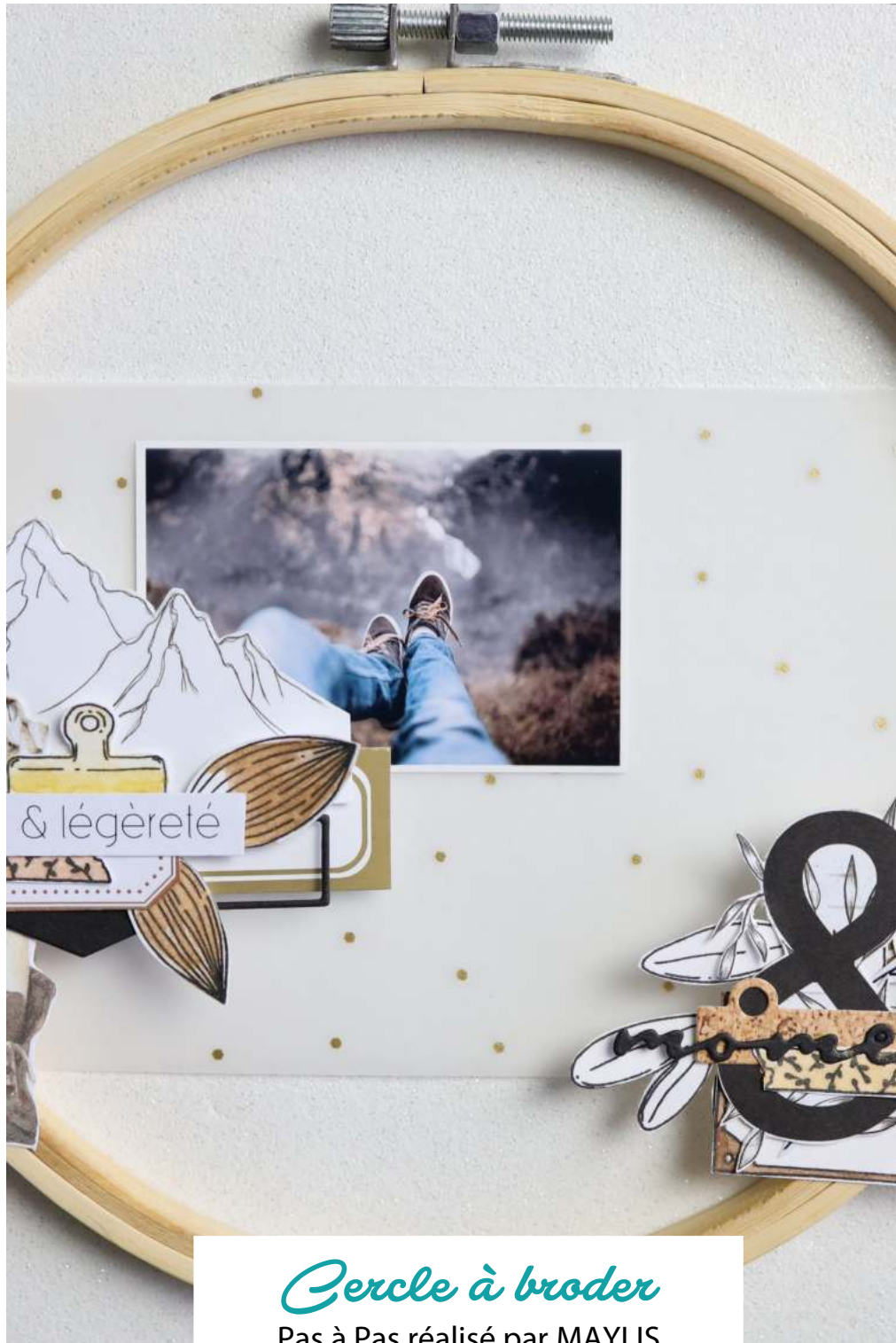
Cercle à broder Pas à Pas réalisé par MAYLIS